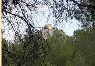
Vista de "la Torreta" entre la pinada