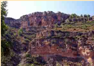
Las Cuevas de los Herreros