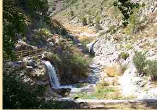
El Río Palancia. Comienza la Vuelta de la Hoz