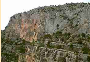
Zona de Escalada