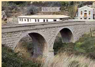
Puente de Navarza (1926)