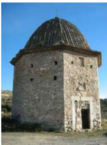
Localización de la ermita del Calvario

Descripción: Está en las inmediaciones de la estación ferroviaria. Presenta especial interés su planta octogonal, con un grueso muro de 90 cm de mampostería y piedras de cantería en la puerta. La puerta está formada por un arco adintelado por dovelas y un arco de descarga sobre el dintel. El interior está cubierto por una cúpula peraltada que al exterior se cubre con tejas de color azul. Se ilumina por tres ventanas de ladrillo adinteladas inmediatamente debajo de la cúpula. De las estaciones del Vía Crucis se conservan dos en ruinas de forma octogonal. (Catálogo Arquitectónico: Patrimonio del Alto Palancia)