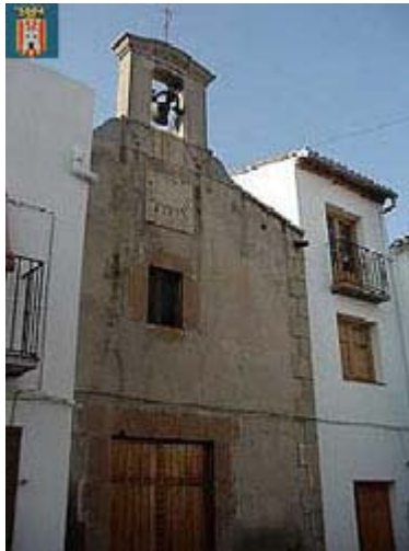
Localización de la Iglesia Parroquial San Miguel

Descripción: Iglesia de la cual, exteriormente, solo es visible la fachada, ya que está rodeada de edificios. Portada adintelada sobre la que se encuentra un reloj de sol con la inscripción: 29 de Sept. 1947. La fachada está rematada por una espadaña. Esta construida en mampostería y sillería, de un solo tramo con ventana rectangular. La cubierta exterior es a dos aguas. Interiormente, la única nave de la que consta, está dividida en tres tramos. El sistema de cubrición es de bóveda de cañón con lunetos en la nave y presbiterio, y cubierta plana en la sacristía. Existe un retablo mayor de madera con la figura central de San Miguel, flanqueado por columnas de orden compuesto decoradas en la parte inferior del fuste con motivos vegetales y guirnaldas. El ático del retablo está rematado por una decoración a la manera barroca. Este retablo se realizó en 1947 gracias a la donación de D. Antonio Girón de Velasco. En cuanto a la decoración, en la nave se pueden contemplar dos retablos de finales del siglo XVII de escayola policromada. (Catálogo Arquitectónico: Patrimonio del Alto Palancia).