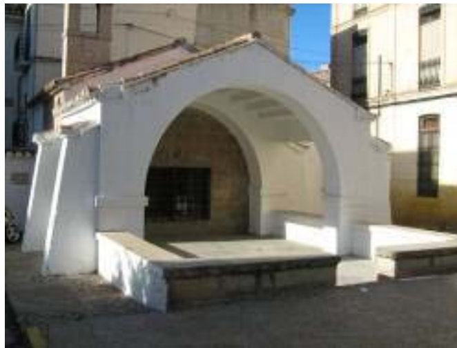
Localización de la Ermita del Loreto

Código: 12.07.071-004 Denominación: Ermita del Loreto Municipio: Jérica Comarca: El Alto Palancia Provincia: Castellón Tipología: Edificios religiosos-iglesias-ermitas Estado: BRL (Genérico) Categoría: Monumento de interés local Grado protección: Se remite al régimen jurídico de los BRL